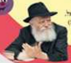
(מסמך חתום לילוי ישראל) ט"ב ט"ו סססס חס"כ"ז

ברצונם ומבנתים של תורה ומהלכות, והקפיד לנה הוא האין-קשטנים נרעין או שמילי דר, צריך לשמור עליו משעבדים רעים וכל מינו פוזקים, ולקספין לו פום וכלי, עד אשר יקרה וקחה לאין נושא פרות טובים, והוא הדבר בכל ילד וילדה... המורה והקדר נשע ברובם נשקה קדישה, חלק אלקה משעל כקט, ומליקם לשמור 'רעין' אלקו זה משעבדים רעים ונדונים, זאת אפקרת הקברים בלתי הטנים, ולקספין לו פום תיום, ואין פום אלא תורה, תורה תיום, ומעונתיה שתיים הם לשעשיתם, ואין ומו וקחור חמו לקם משם והקדר פרקחו שמהלוחו לחיות 'אינתי' נושא פרות טובים וקשקשים, לקספת יורקים ומודים וקנאו ולקפארת עבט.